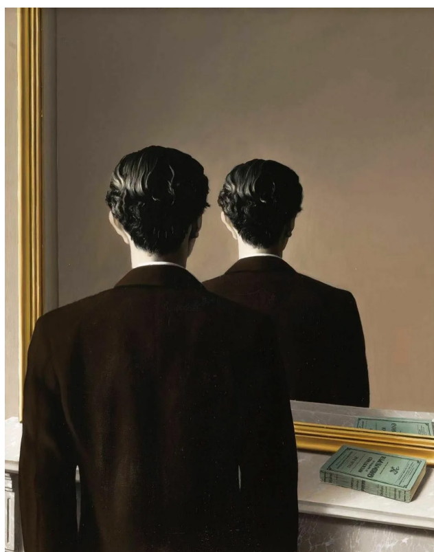
Иллюстрация: Рене Магритт. «Репродуцирование запрещено». 1937